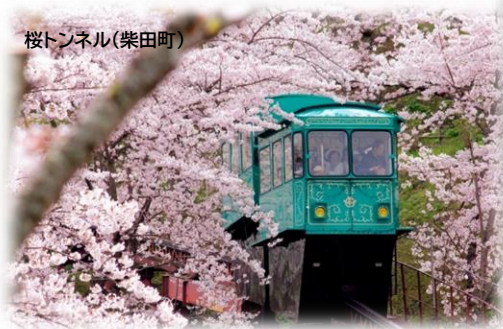
桜トンネル(柴田町)