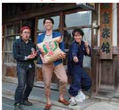
先輩隊員と一緒に大崎市を盛り上げよう！